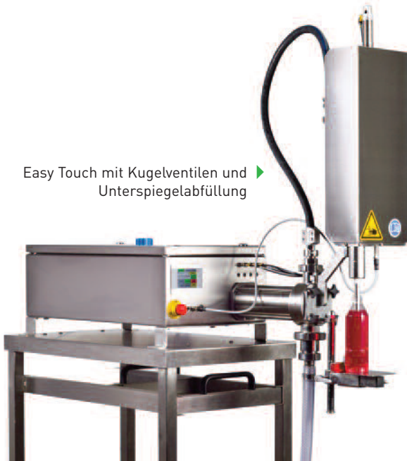
Easy Touch mit Kugelventilen und Unterspiegelabfüllung