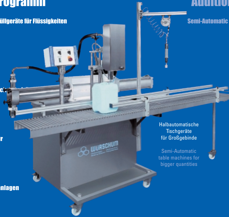
Halbautomatische Tischgeräte für Großgebinde

Semi-Automatic table machines for bigger quantities