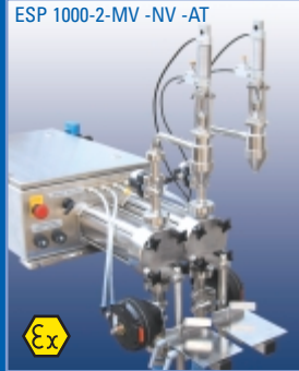
ESP 1000-2-MV -NV -AT